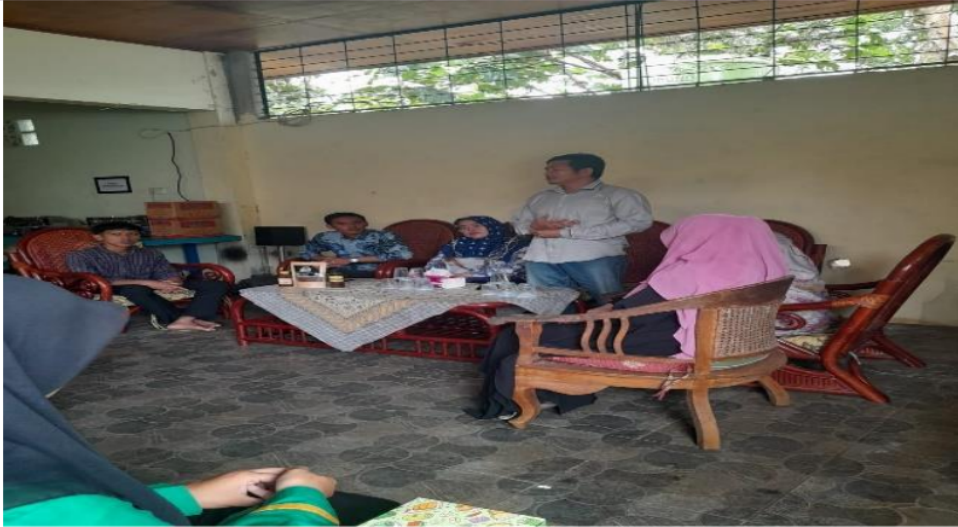
Gambar 2. Peserta serius mengikuti kegiatan