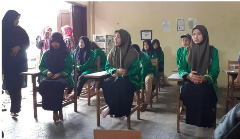
Gambar 1. Kegiatan Sosialisasi