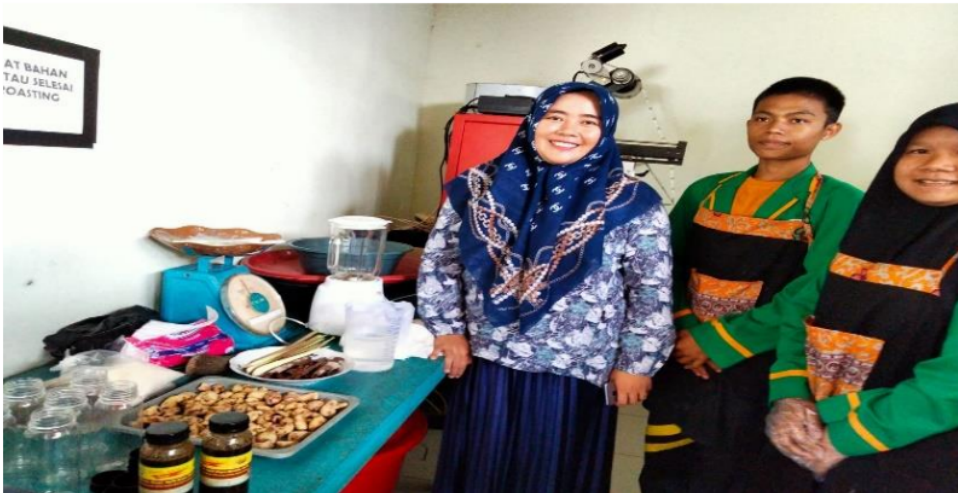
Foto 3. Melihat langsung proses pembuatan Syrup Jahe Merah