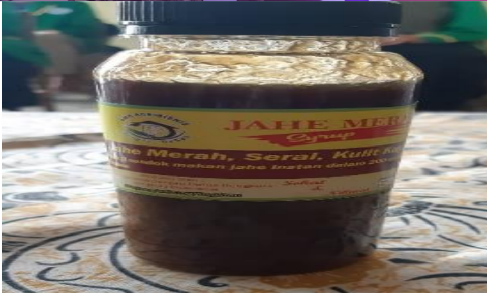
Gambar 4. Produk Syrup Jahe Merah yang telah jadi dan dikemas