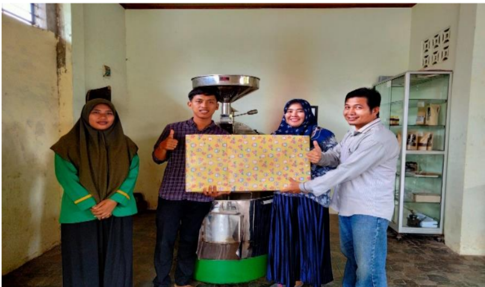
Foto 5. Mewakili Tim Pengabdian memberikan Kenang-kenangan